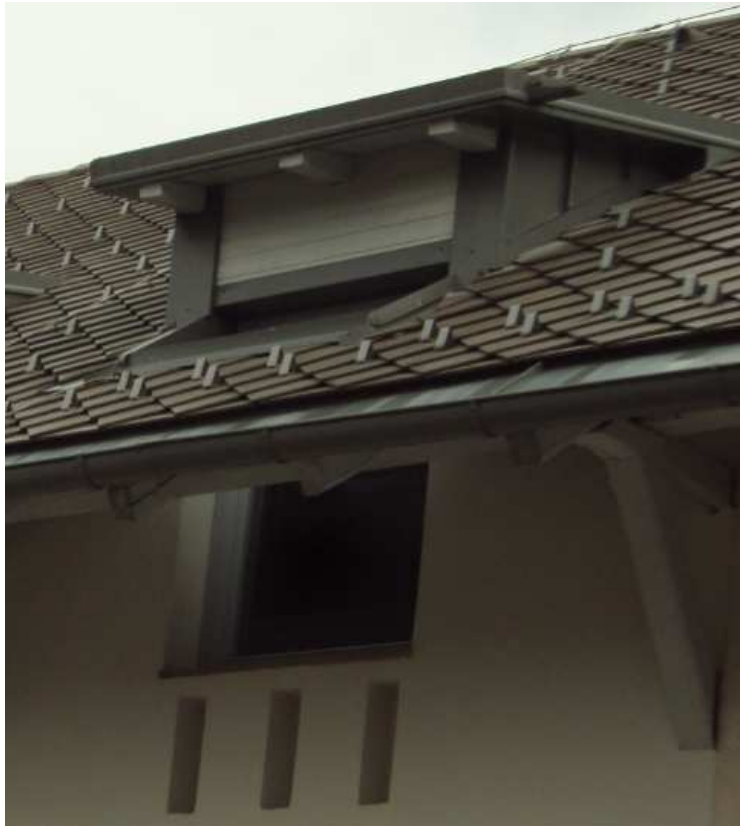
FRČADE- SEVERNA STRAN